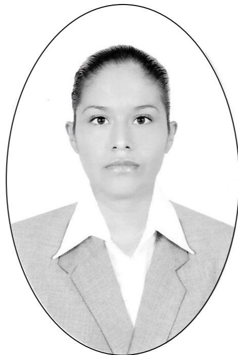
Fotos tamaño Título 6cm. x 9cm.