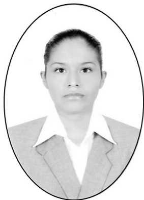
Foto tamaño óvalo mignon 3.5cm. X 5cm.

Hombres: Cabello corto, sin barba, sin bigote y sin patillas, orejas y frente descubierta, camisa con cuello, saco y/o corbata.