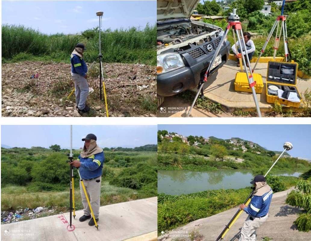
28 de septiembre de 2020 Beneficiario: Bienes Comunales de Santa Cruz Tagolaba

El L.B.M. Oscar Eliel Carreño Reyes realizó el procesamiento de las fotos para crear el modelo digital de elevación y mosaico georeferenciado. Estos productos serán utilizados para el análisis hidrológico e hidráulico, que realizará como colaboración la Universidad Tecnológica de la Mixteca (UTM). El resultado de estos estudios permitirá avanzar con las correcciones necesarias de la manifestación de impacto ambiental propuestas por la Secretaría de Medio Ambiente y Recursos Naturales (SEMARNAT).